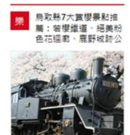
桜スポット紹介記事