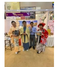
文化交流イベントの様子