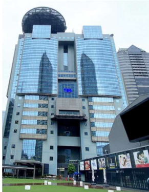
赤坂サカス Sacas 広場