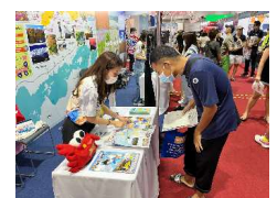
鳥取県ブースの様子

「コナンが大好きなのでぜひ鳥取に行ってみたい。」「桜が綺麗なスポットが多く見に行ってみてみたい。」「大阪から2時間半は少し遠いかもしれないが交通アクセスを調べて行ってみたい。」等