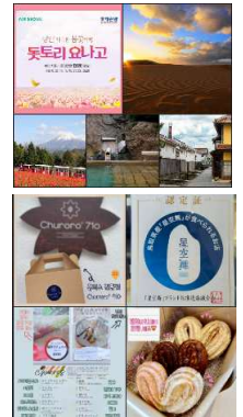
県公式 SNS での魅力発信

「鳥取駅の観光案内所の韓国語が話せる親切なスタッフに感謝している。」「鳥取県には旅行の魅力がたくさんあり、周りの知り合いにお勧めしたい。」等