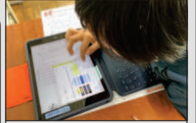
通級指導での「デイジー教科書」活用の様子

「デイジー教科書」の活用で、読みの改善や内容の理解、学習意欲の向上などの効果が期待できます。