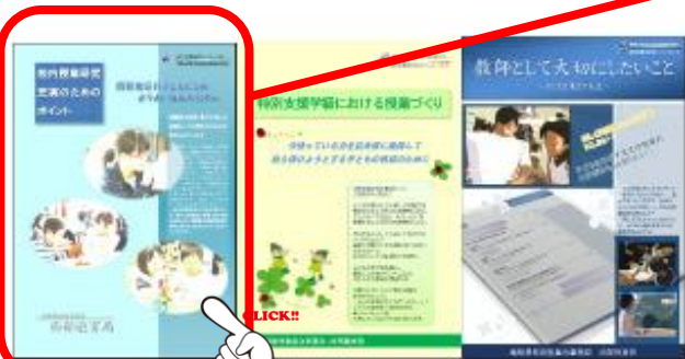
特別支援学校における授業づくりのリーフレット(前半) 特別支援学校における授業づくりのリーフレット(後半)