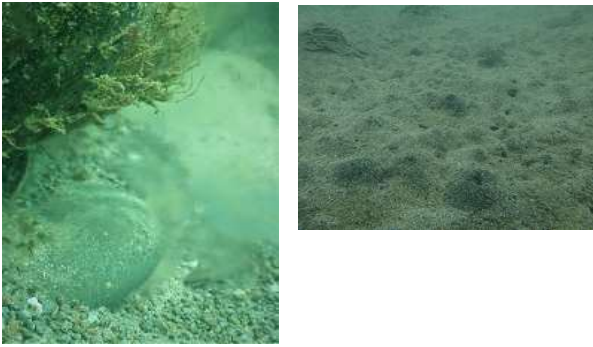
図4 海底湧水（左：御崎海岸，右：御崎漁港内）