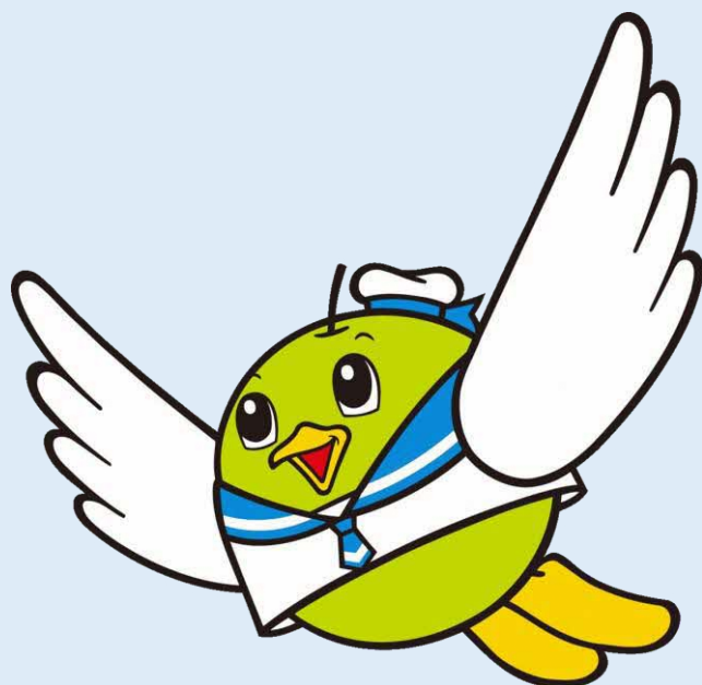
鳥取県マスコットキャラクター 「トリピー」