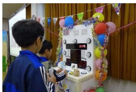
〈学園祭でのゲーム機製作〉