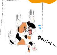
タイトル名 「無意識(思い込み)の壁ほど高いものはにゃい」