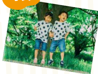
タイトル名 「男の子らしい」「女の子らしい」ってなんだろう？