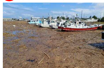
8 鳥取港 漂流物堆積