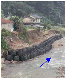
1 天神川（三朝町久原）の護岸崩落