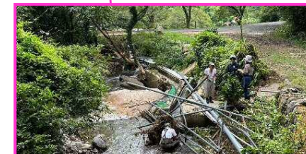
養魚場取水パイプの流出