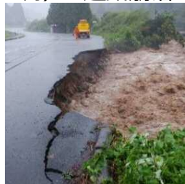
2 国道179号（三朝町穴鴨）の道路崩落