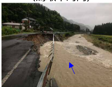
3 県道河内楨原線（鳥取市河内）