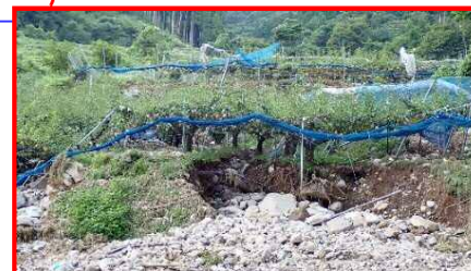
果樹園への土砂流入、果樹棚損傷