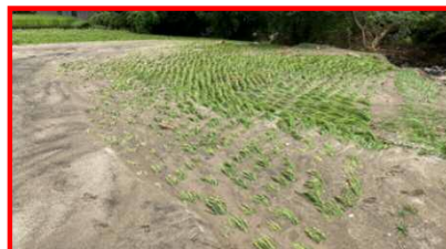
水田への土砂流入