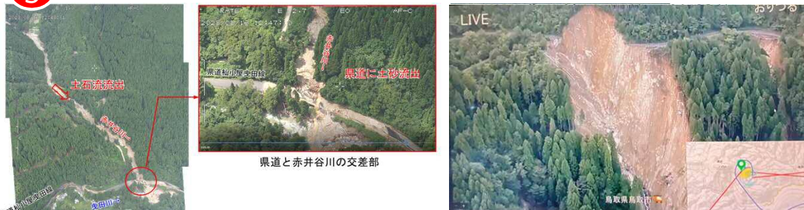
6 県道麻生国府線（八頭町福地）の道路崩落