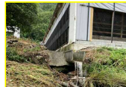
牛舎敷地内への河川流入による側溝基礎崩壊