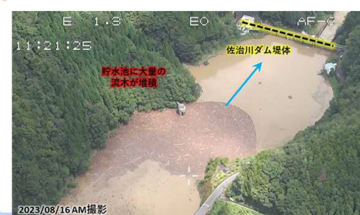
4 佐治川ダム（鳥取市佐治町尾際）の流木及び土砂の堆積