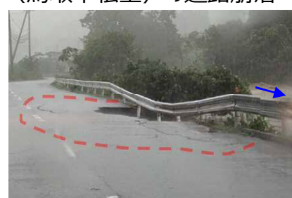
県道鳥取河原用瀬線（鳥取市松上）の道路崩落