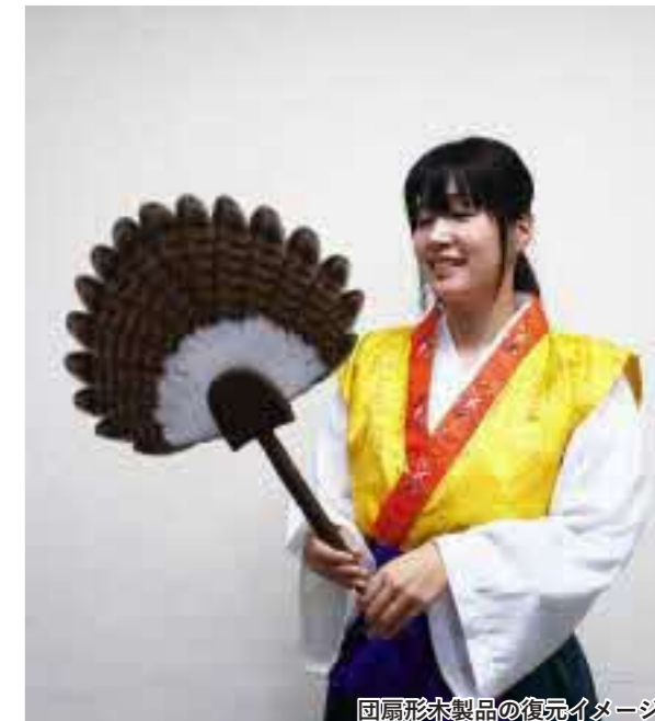
団扇形木製品の復元イメージ