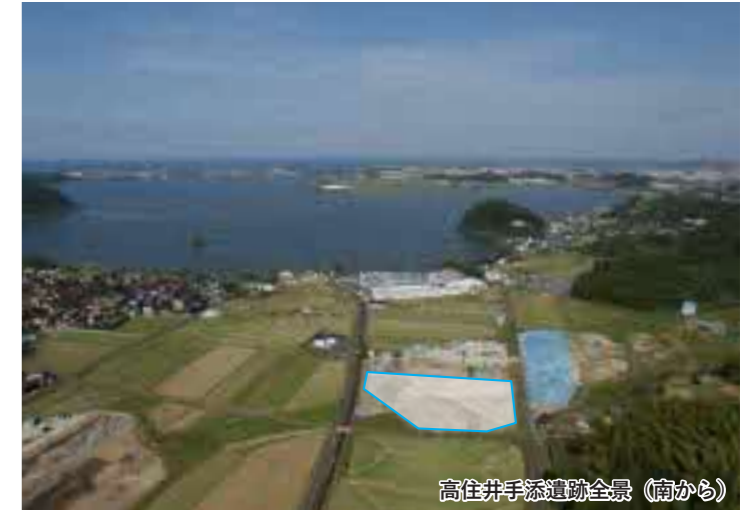
高住井手添遺跡全景（南から）

また、弥生時代の小海退が起きる弥生時代中頃（約2,000年前）には、水の流れをコントロールする堰や護岸などの構造物が築かれていたことが確認され、当時の土木技術を考える上で非常に重要な発見がありました。