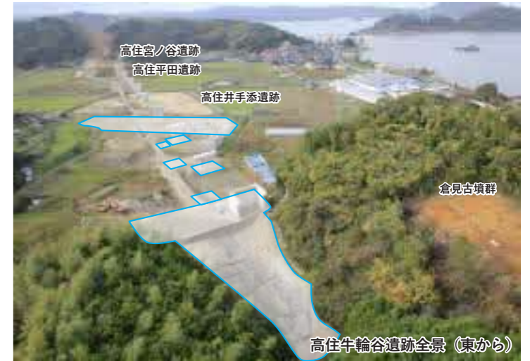
高住牛輪谷遺跡全景（東から）

遺跡の最盛期は古墳時代終わり頃（約1,400年前）で、谷部分を大規模な造成で埋め立てて、その上に竪穴建物や掘立柱建物を築いていました。また、暗渠を備えた溝からは木製祭祀具のほか「団扇形木製品」が発見され、当時の権力者の存在を明らかにする重要な遺物です。