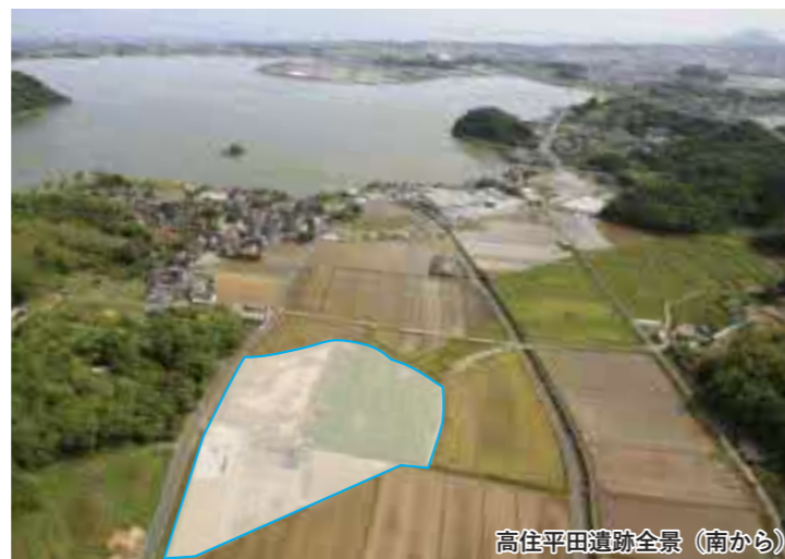
高住平田遺跡全景（南から）

鎌倉時代以降になると遺跡周辺には水田が広がっていたようで、川や溝を利用して耕作を行っていたようです。