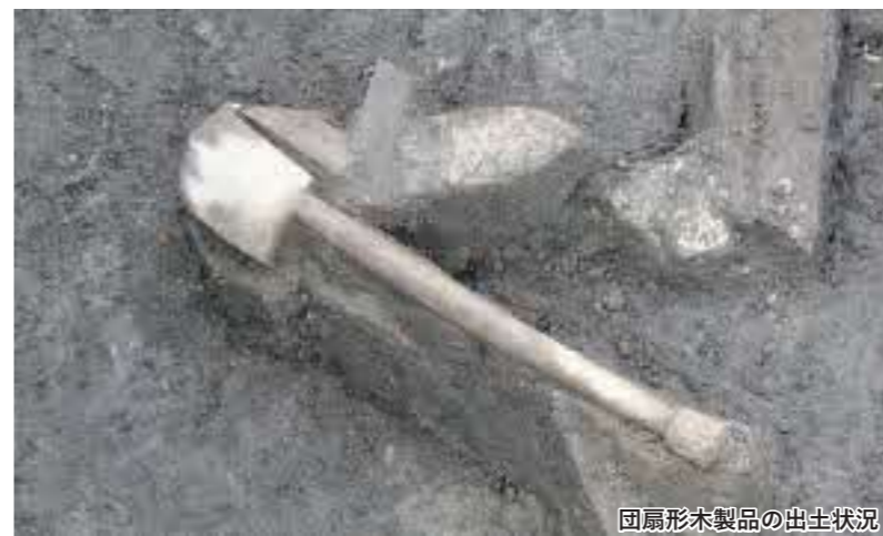
団扇形木製品の出土状況

古墳時代終わり頃の出土例は全国的に珍しく、高住の地に当時の権力者が存在していたことを示す貴重な出土品です。また、鳥取西道路の発掘調査では、松原田中遺跡でも古墳時代初め頃の団扇形木製品が2点出土しています。松原田中遺跡も大型建物跡や玉作の跡など当時の権力者の存在が推定される集落遺跡で、いずれも湖山池南岸の古墳時代を解明する上で重要な遺物です。