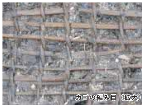
カゴの編み目（拡大）