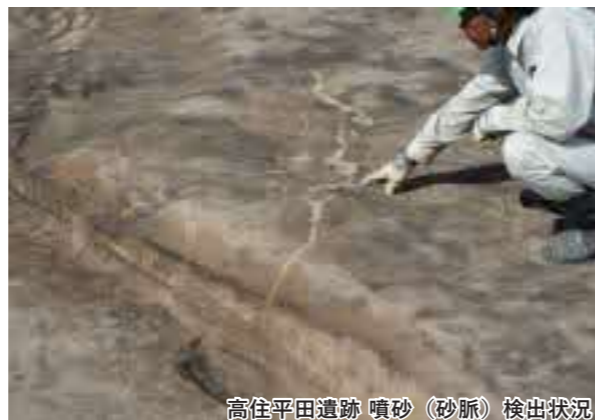
高住平田遺跡 噴砂（砂脈）検出状況

高住平田遺跡ではこのような噴砂の痕跡が数箇所見つかっています。噴砂は震度6以上の大地震が発生した際に形成されると考えられており、この地域で過去に大地震が発生したことを物語っています。