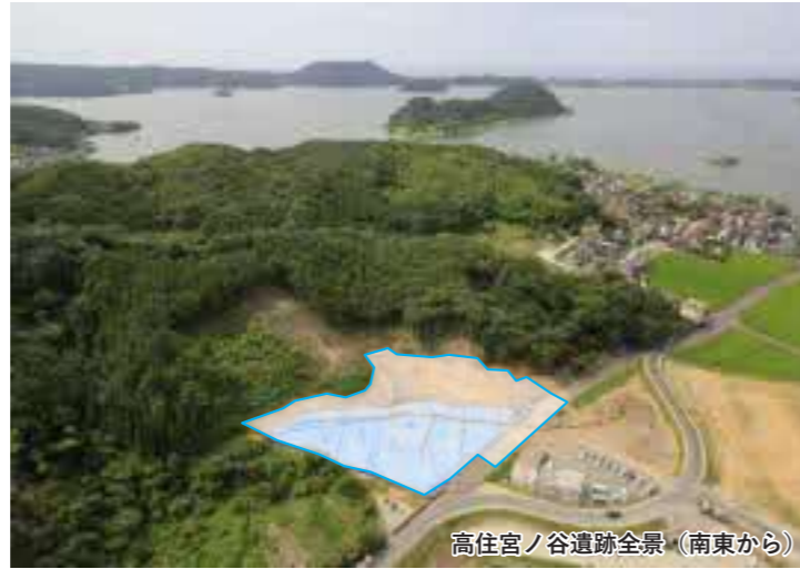
高住宮ノ谷遺跡全景（南東から）

中世以降、谷部は水田に利用され、現在まで続きます。また、丘陵裾の土坑からは県内初の「こけら経」が出土し、当時の信仰を考える上で重要な遺物です。