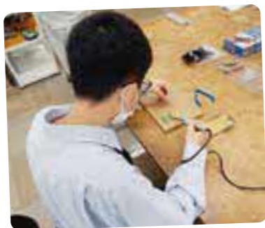
オープンキャンパス①