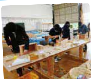
オープンキャンパス③