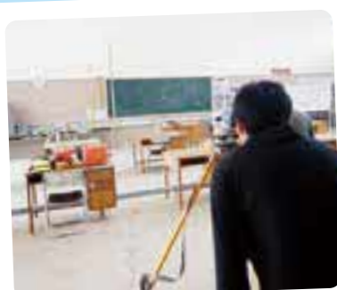
オープンキャンパス②