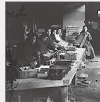
倉吉千歯の製造の様子★

加えて、倉吉千歯の大きな特徴は、職人自らが全国各地に出向き、製品の販売とともに、古い千歯扱きの下取りや修理を行っていたことである。いわゆるアフターケアが充実していたことも倉吉千歯の全国拡大につながった。