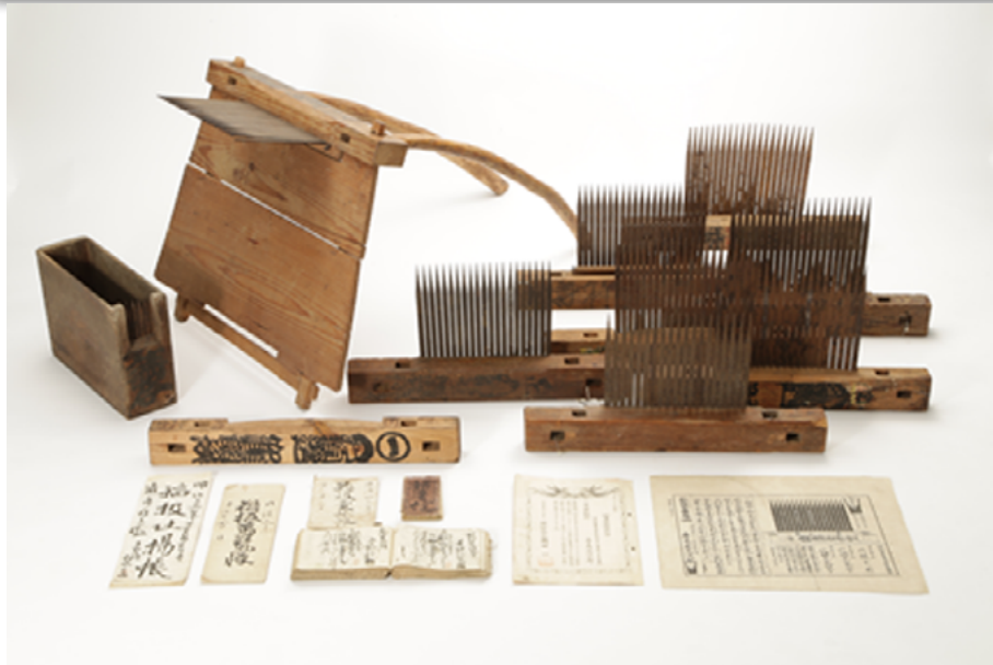
「倉吉の千歯扱き」(倉吉博物館蔵)★