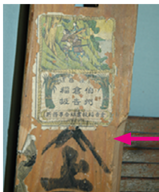
倉吉産であることを示す表示★ 「伯州倉吉稲扱」と記されている。