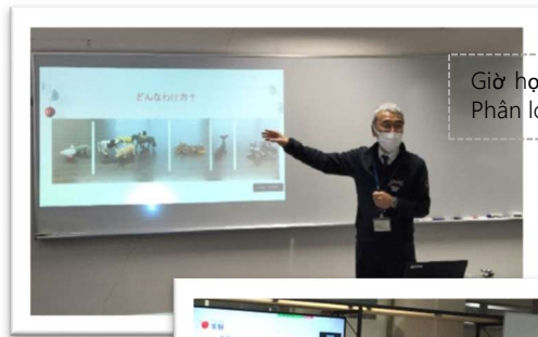
Giờ học môn tự nhiên Phân loại sinh vật

☆ Đây là trường công lập phổ thông cơ sở với hình thức chưa từng có trong tỉnh Tottori. Nằm ở tầng trệt của dãy nhà giáo dục thông tin-Trung tâm giáo dục tỉnh Tottori(Tottori-shi Koyama-cho Kita). Là chương trình phổ thông cơ sở ban đêm, với chương trình học được xây dựng cho phù hợp với trình độ của từng học sinh. Lớp học sử dụng máy tính hay máy tính bảng, tuần học 5 ngày, ngày 4 tiếng.