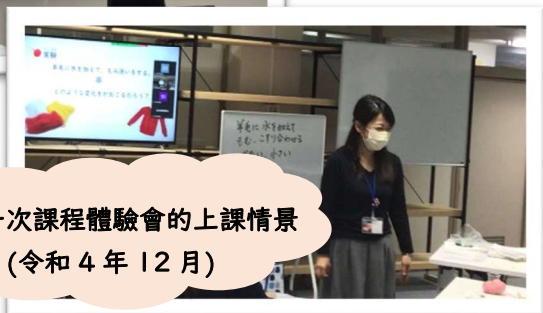
第一次課程體驗會的上課情景 (令和 4 年 12 月)