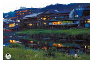
①豪華な松葉がに料理の数々②三朝温泉の老舗旅館「依山楼 岩崎」の露天風呂③三朝温泉名物の「河原風呂」④松葉がにのカニすき⑤三朝温泉の夕景