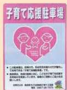
子育て応援駐車場看板

妊娠中の方や就学前の乳幼児等を連れてきた方など（※）が駐車時に安心して乗り降りできるよう、対象者を優先する駐車スペースの設置を進めています。駐車場の利用にあたり、申請手続きは不要です。