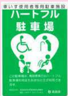
ハートフル駐車場看板

障がいや高齢などで歩行が困難な方、あるいはけがや出産前後で一時的に歩行が困難な方（※）などが県と協定を結んだ施設の専用駐車スペースを適切に利用できるよう、「ハートフル駐車場利用証制度」を導入しています。（平成21年10月1日より）駐車場利用にあたっては申請手続きが必要です。