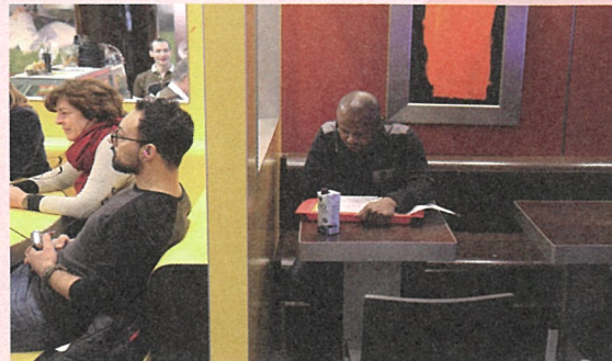
高山明/PortB《McDonald's University@Frankfurt》2017