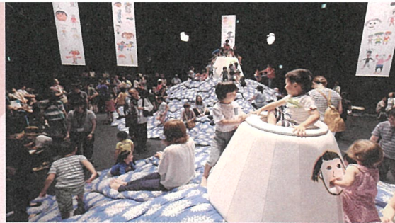
小沢剛《あなたが誰かを好きになように、誰もが誰かを好き【劇場版】》2015 いわき芸術文化交流館アリオス

1961年アルゼンチン生まれ。現在はニューヨーク、ベルリン、チェンマイを拠点に制作活動を行う。作品と鑑賞者の間の壁を取り払い、体験と交流に焦点を当てた参加型の作品で知られている。主な展覧会に2020年「Fear Eats the Soul」(グレンストーン美術館、ポトマック)、2019年「Rirkrit Tiravanija: Who is afraid of red yellow and green.」(ハーシュホーン博物館、ワシントン D.C.)ほか、ヴェネツィア・ビエンナーレをはじめ、国際展にも多数参加している。国内では2022年の岡山芸術交流にてアーティストリック・ディレクターを務めたほか、2015年「誰が世界を翻訳するのか」(金沢21世紀美術館、金沢)など多数の展覧会に出品。