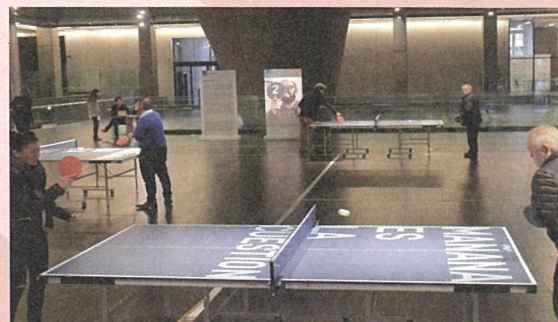
リクリット・ティラヴァニ《Untitled 2016 (tomorrow is the question-mañana es la cuestión)》2016 CCK, Buenos Aires, Argentina