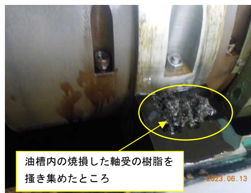
<軸受の樹脂が焼損>