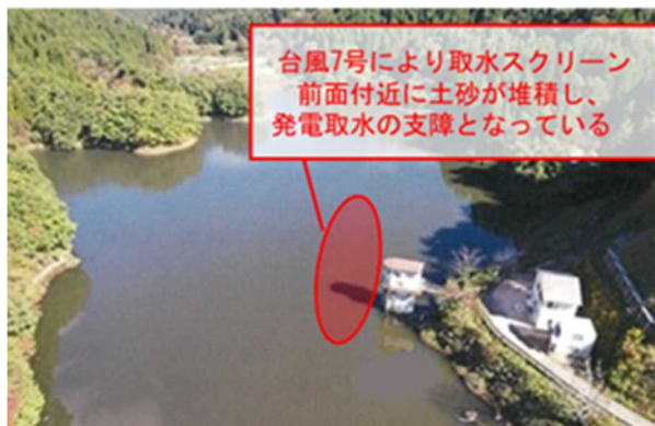
ダム堤体より取水塔を望む