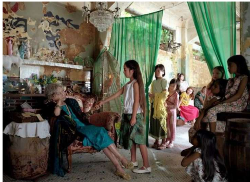
やなぎみわ《My Grandmothers AI》2003年