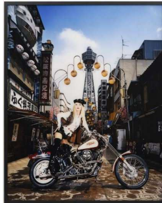
森村泰昌 《Self-portrait / after Brigitte Bardot 2》1996年