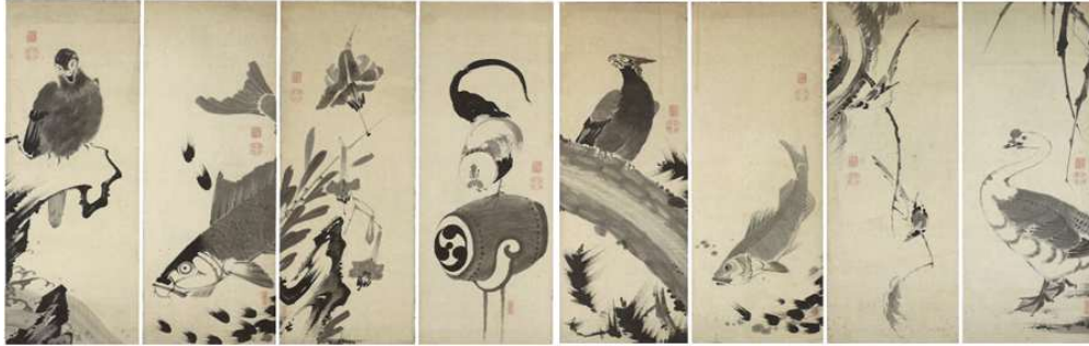
伊藤若冲《花鳥魚図押絵貼屏風》江戸中期