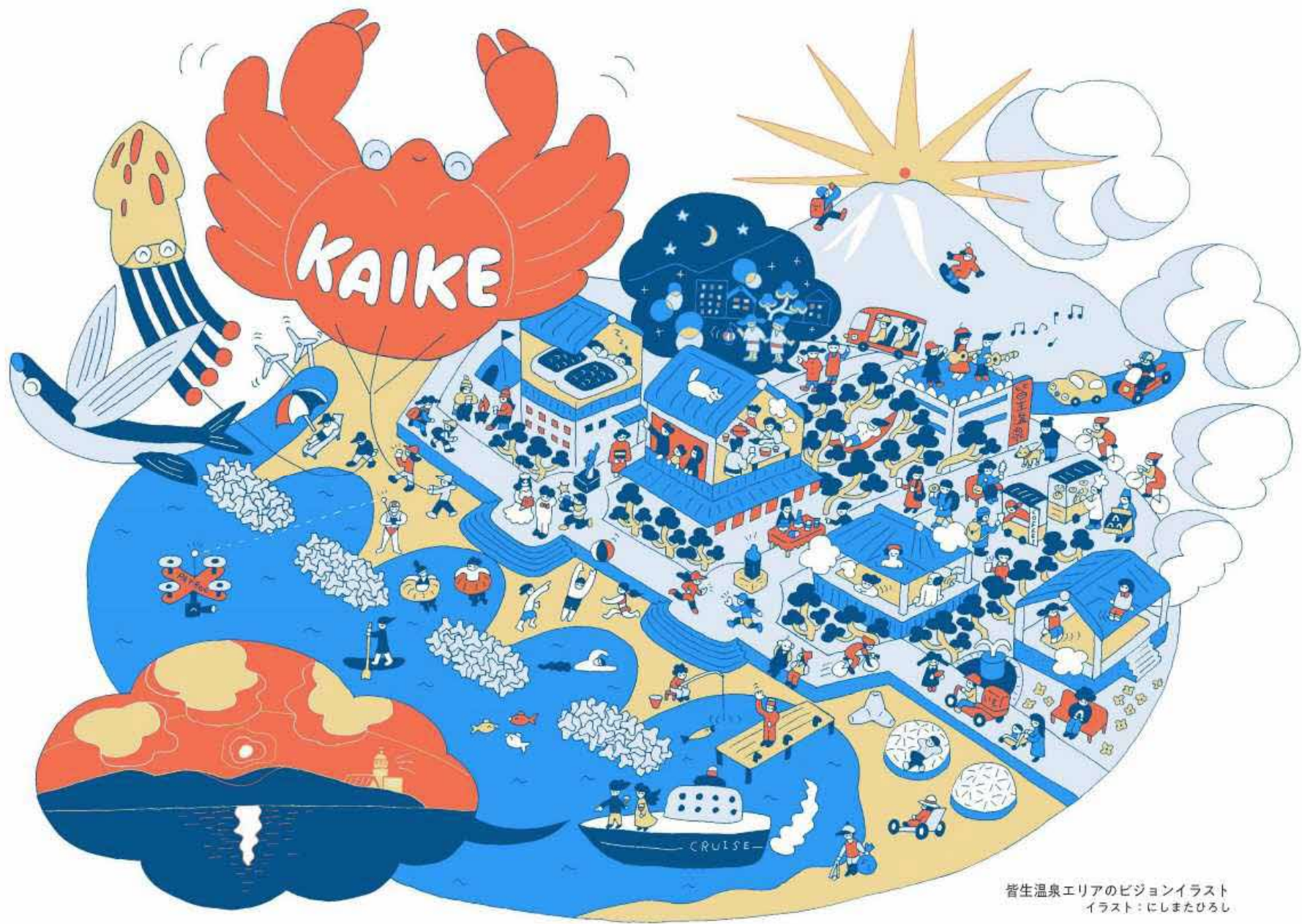
皆生温泉エリアのビジョンイラスト イラスト：にしまたひろし