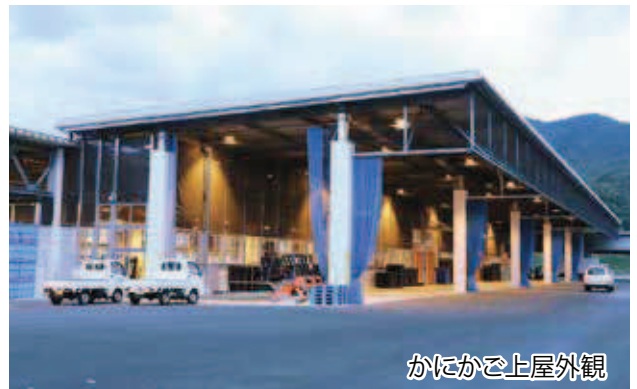
かにかご上屋外観