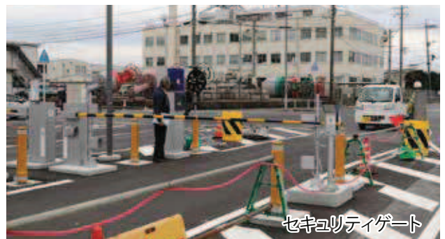
セキュリティゲート