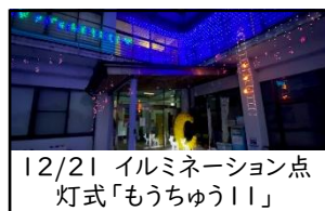
12/21 イルミネーション点灯式「もうちゅう11」