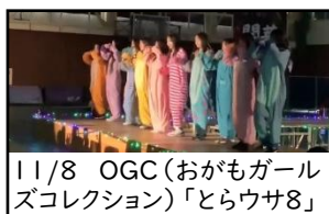
11/8 OGC(おがもガールズコレクション)「とらウサ8」

小鴨地区の中高生の地域活動グループが今年は何をするのか、大人をどうまきこんでいくのか、これからが楽しみです!