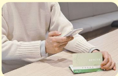
郵便物や書類の確認