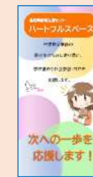
ハートフルスペース リーフレット