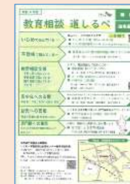
教育相談 道しるべ