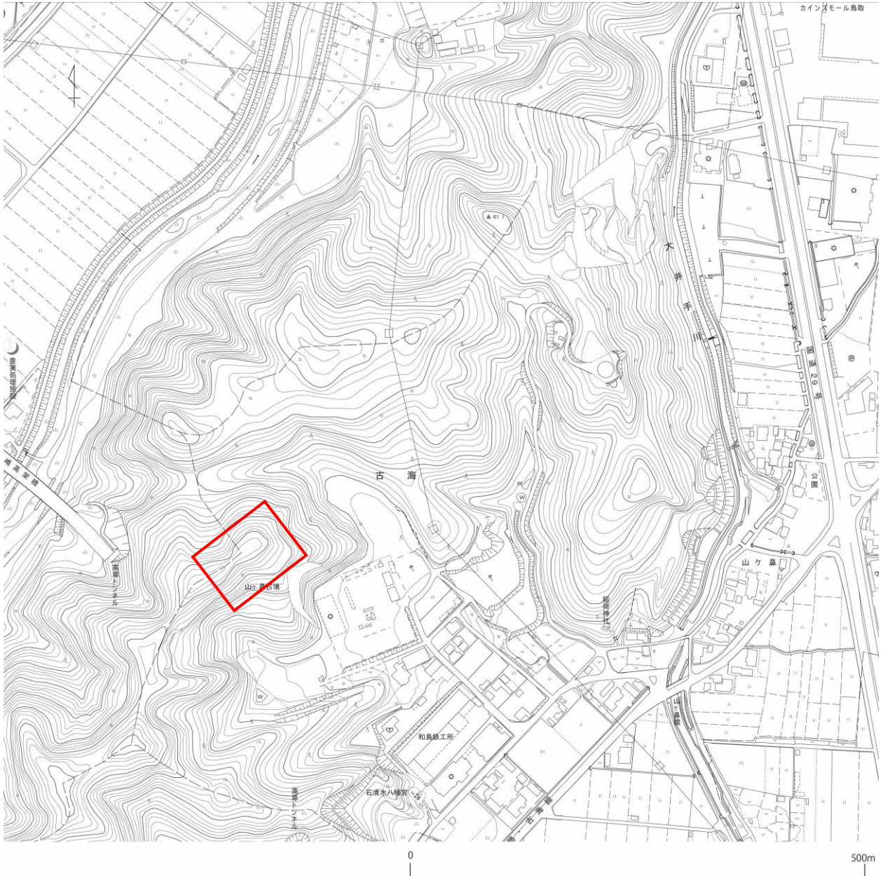
業務対象地位置図