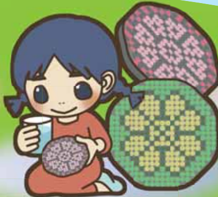
古代瓦文様の コースターづくり