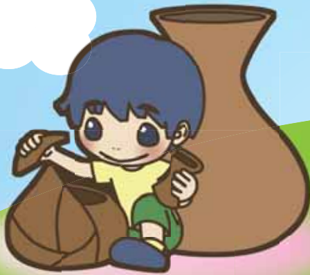
チャレンジ! 土器・木器パズル