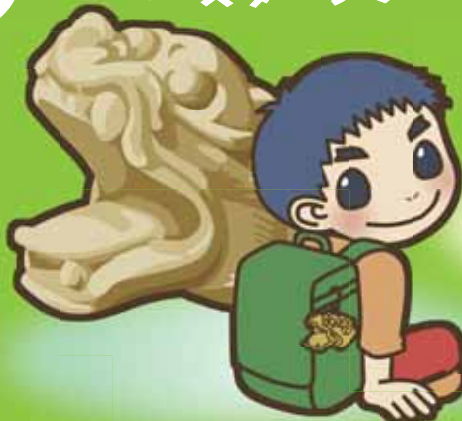
獣頭キーホルダーづくり