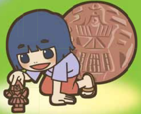
ミニはにわづくり