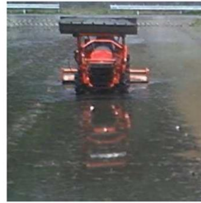
図1 節水代かきのようす