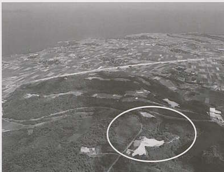
写真 1 妻木晩田遺跡全景（南から）（柏原賢司氏撮影、円内が松尾頭地区）