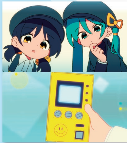
楽曲「みずたま」「幾何学」MVより