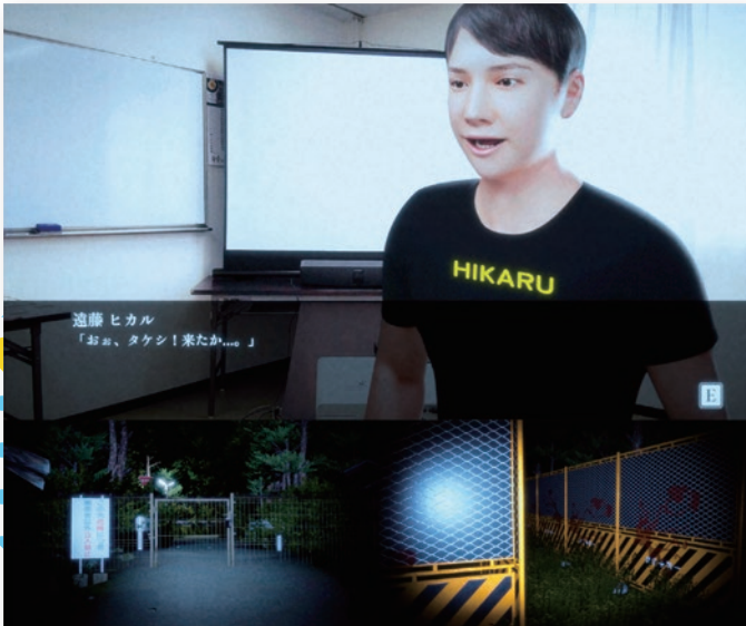
ゲーム「失踪〜タケシ、お前の言う通りだった。 あの廃村はやばすぎる。〜」より