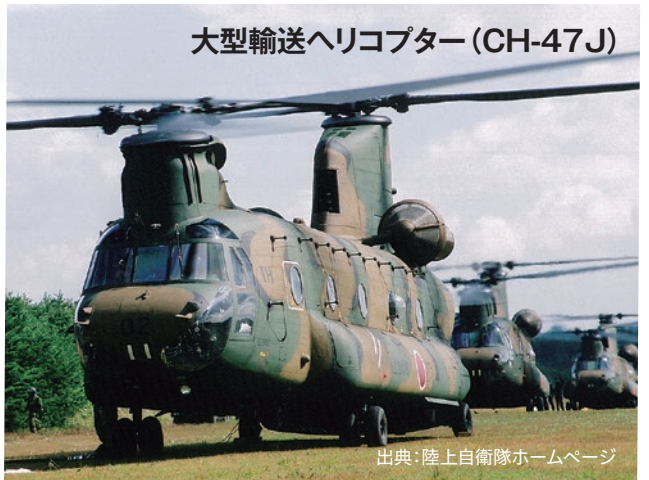
大型輸送ヘリコプター(CH-47J)