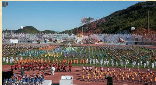
「ねんりんピック紀の国わかやま2019」開会式の様子

全国から参加される選手の皆様を歓迎し、鳥取県の魅力とおもてなしの気持ちを伝える総合開会式と、大会を振り返りねんりんピックの意義と想いを次期開催県に繋ぐ総合閉会式を開催します。皆様のお越しをお待ちしております♪