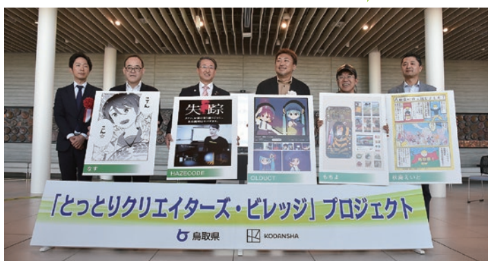
プロジェクトの始動に際して開催されたキックオフイベント。地元関係企業等がプロジェクトへのエールを送りました(5月、境港市民交流センター「みなとテラス」)

県内でも漫画家のふるさとが聖地として観光スポットとなってきたように、コンテンツの聖地は、地域活性化の大きなカギにもなります。