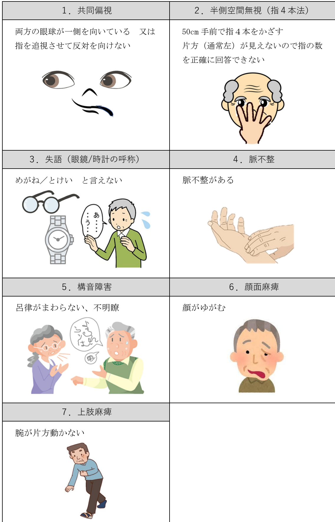
別表 1 - 2 脳卒中が疑われる傷病者に対する身体観察