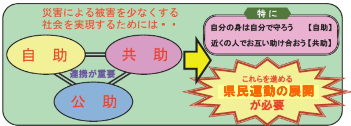
自助・共助・公助による災害被害軽減の模式図

地震に対して安全・安心を確保するためには、行政（県・市町村）による震災地震津波対策を強化し「公助」を充実させていくことはもとより、県民や事業者が自ら取り組む「自助」、地域の住民や事業者が力を合わせて助け合う「共助」の取り組み、さらにはこれらの連携が不可欠である。各自がそれぞれの役割についての理解を深め、積極的な取り組みを進めていただきたい。