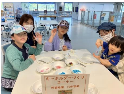
おさかなパーク春祭り