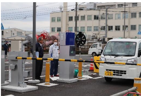
セキュリティゲート運用開始