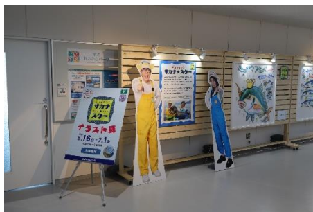
サカナスターイラスト展