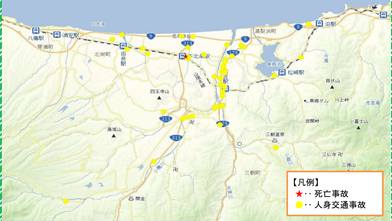
人身事故発生状況 令和6年1月～令和6年5月