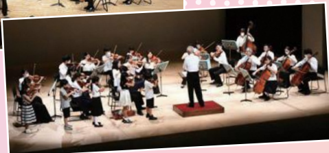
鳥取ジュニア オーケストラ