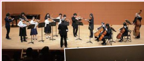
倉吉ジュニア オーケストラ