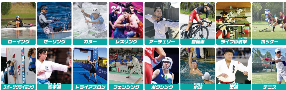
実施会場：鳥取県立総合体育館、鳥取県立総合体育館