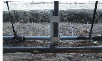
写真7 パイプ地際の腐食部分の補強