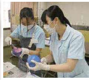
▲オープンキャンパス