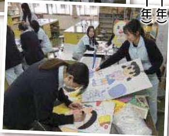
▲保育園・幼稚園実習