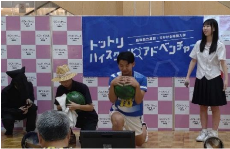
鳥取中央育英高校 コントで学校紹介