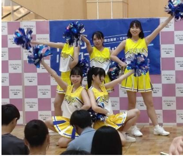
倉吉東高校 チアリーディング