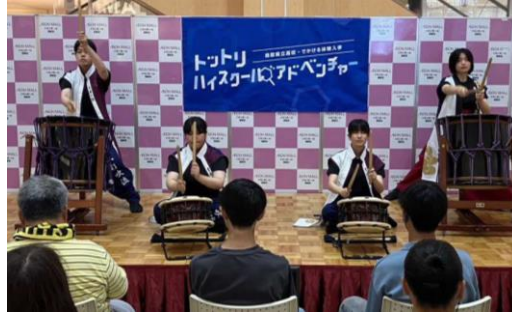
倉吉農業高校 打吹太鼓