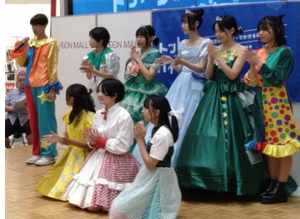
米子南高校 ファッションショー