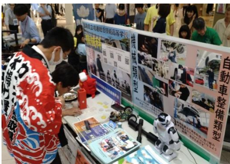
境港総合技術高校