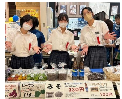
鳥取湖陵高校 物販ブース