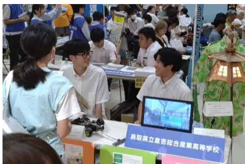
倉吉総合産業高校