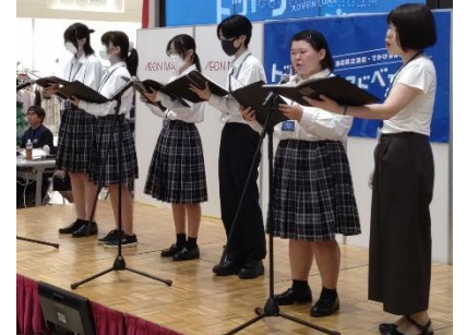
米子高校 UTA 同好会の合唱