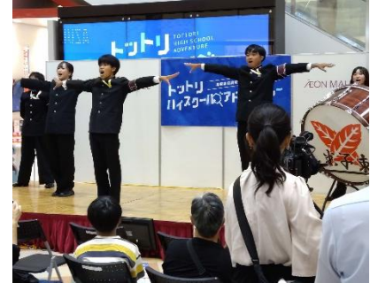
米子東高校 応援團