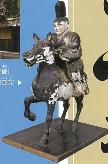
みとくさんぜんぶつじ (三徳山三佛寺) ▶