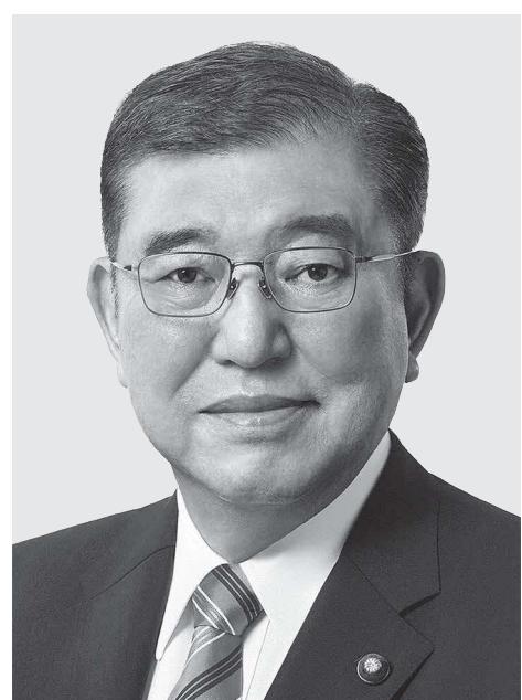
自由民主党総裁 石破 茂

比例代表は「維新」または「日本維新の会」とお書きください。 小選挙区は候補者名をお書きください。