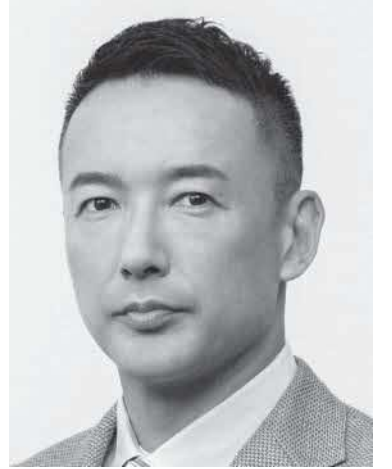
れいわ新選組 代表 山本 太郎