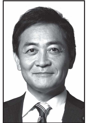
代表 玉木 雄一郎