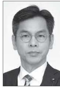
党中央幹事 前衆議院議員 平林 晃