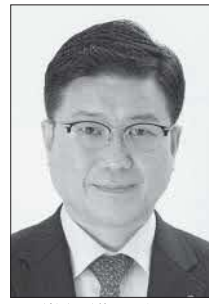
党組織局長 前衆議院議員 日下 正喜