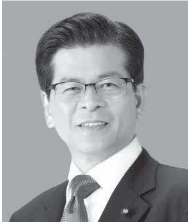
公明党代表 石井 啓一

人それぞれに夢や希望があります。私たちは、一人ひとりがそれを実現できる日本にしたい。小さな声を聴く力、粘り強い政策実現力、国と地方をつなぐ力。こうした公明党の堅実な力で、未来につながる改革を進めます。「希望の未来は、実現できる」そう誰もが思える日本へ、公明党は力の限り働きます。