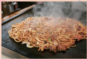
津山ホルモンうどん