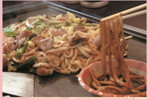
佐用ホルモン焼きうどん