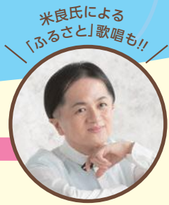
米良氏による 「ふるさと」歌唱も!!