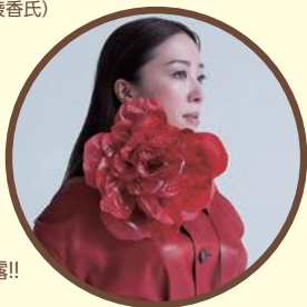
平原綾香氏 あいサポート運動 テーマソングを披露!!