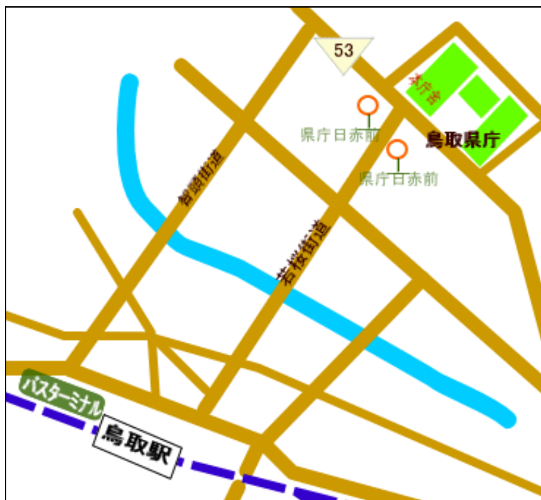
鳥取県庁本庁舎 (バス停「県庁日赤前」下車)