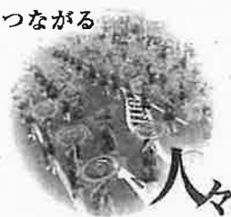
鳥取しゃんしゃん祭