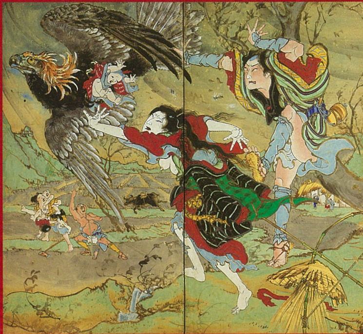
「花衣いろは縁起 鷲の段」 二曲一隻屏風・紙本彩色 香南市赤岡町本町二区