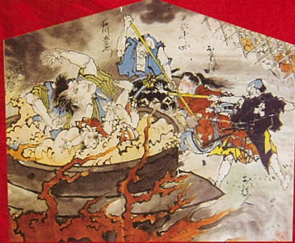
「釜淵双紙巴(24点の内)」 絵馬提灯・紙本彩色 創造広場「アクトランド」 ※2点とも