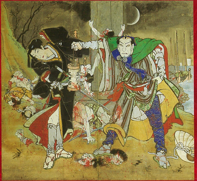
「浮世柄比翼稲妻 鈴ヶ森」 二曲一隻屏風・紙本彩色 香南市赤岡町本町一区