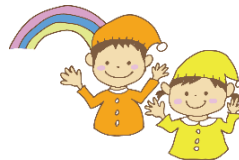
◀ 幼児教育のマスコットキャラクター「あそびきるん」と「あそびっくい」