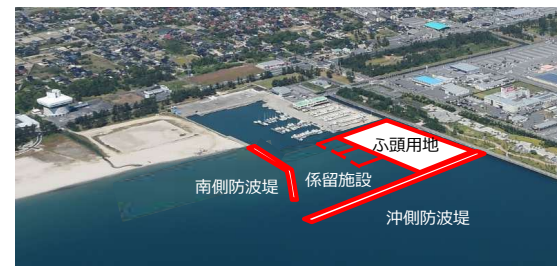
境港公共マリーナ拡張計画(整備イメージ)