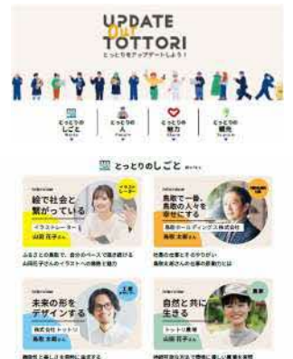
「とっとりデジタル教材」画面イメージ