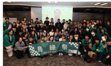
「鳥縁祭」での集合写真