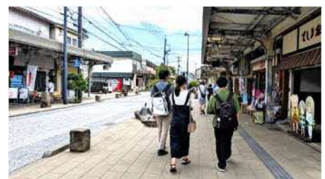
職場体験の合間に地域散策