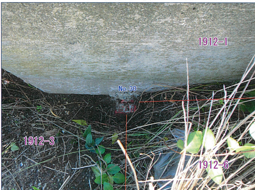
No. 30 標識: コンクリート杭 (既存)