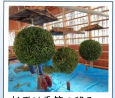
杉玉は季節の移ろいとともに少しずつ色が変わるそうです!