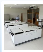
新しく調理室が作られました!