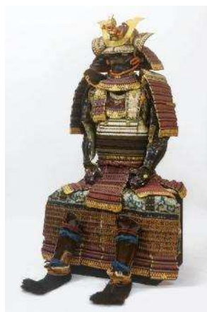
色々威胴丸具足（池田吉泰所用甲冑）（当館蔵）