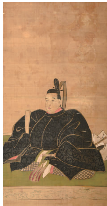
3代藩主池田吉泰肖像 元文4年(1739)作成 坂川権右衛門画