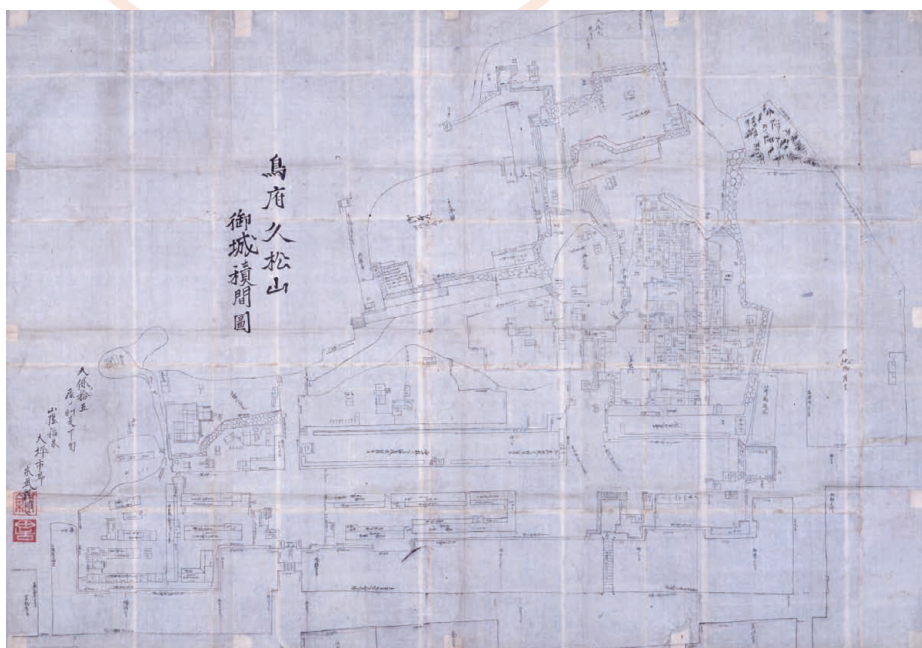
鳥府久松山御積間図 天保15年(1844) 鳥取城の各曲輪などの寸法が詳しい