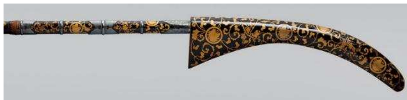
梅唐草蝶文蒔絵薙刀拵の先端部分拡大