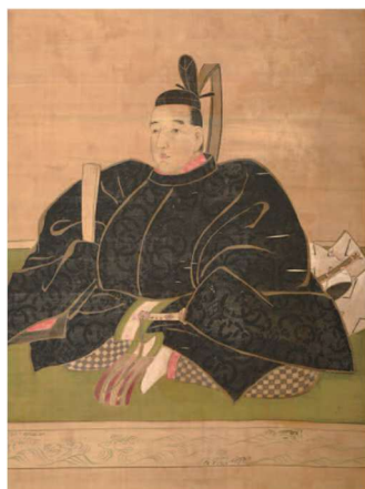
3代藩主池田吉泰画像